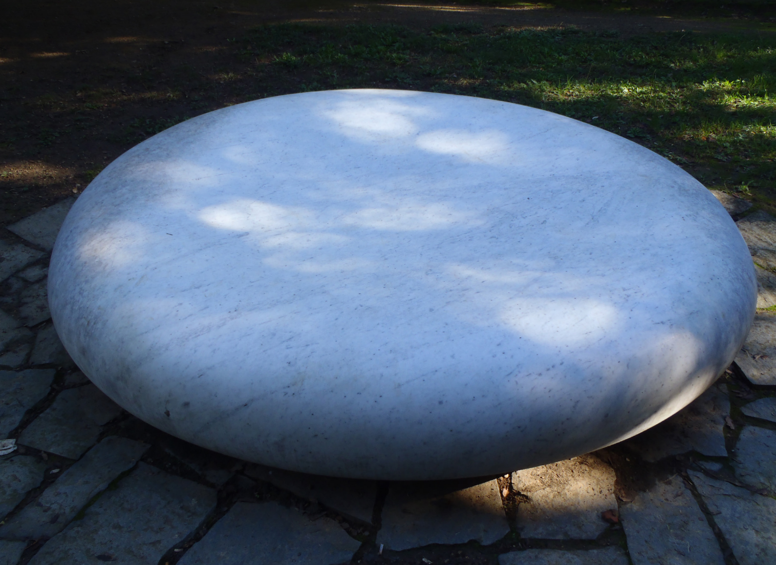
Abb. 3: Kan Yasuda: Secret of the sky/Firenze

was den Menschen unbedingt angeht“. Denn: „Nur das, was heilig ist, kann den Menschen unbedingt angehen, und nur das, was den Menschen unbedingt angeht, hat die Qualität der Heiligkeit.“ 7 In der Folge ist jeder Ethik bereits aus der Sicht der Bibel als Motiv mitgegeben, dass „Heiligkeit“ als „Glauben und angemessenes Verhalten“ 8 erkennbar wird.