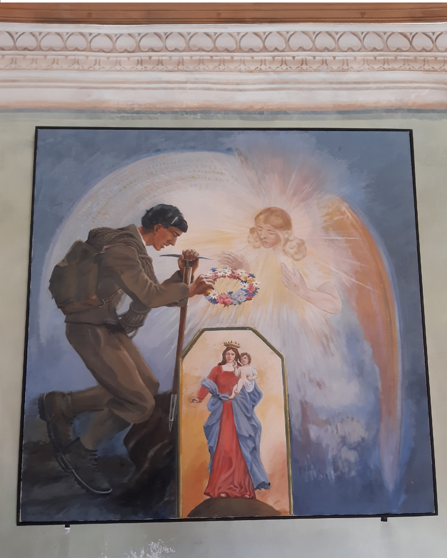
Abb. 7: Maria zum Schnee Kapelle / Schwarzsee ob Zermatt

Weise, sei es in der überpersönlichen Gegenwart des Göttlichen, in der Vergebung durch die Macht der Gnade, die ein Mensch erfährt oder im Charakter jedes Gebetes, das jemandem „Du“ sagt, der „dem Ich näher ist als das Ich sich selbst“. 25 Vor diesem Hintergrund ist für Theologie und Seelsorge die Perspektive bedeutsam, welche Ottmar Fuchs vom zerrissenen Gott sprechen lässt als Synonym für „ein ganz bestimmtes Gottesbild“, das am Kreuz zerreisst. 26 Das Geschehen am Kreuz lässt nämlich den Schluss zu, dass sich im göttlichen Zerrissen-Sein die menschliche Sehnsucht nach Erlösung mit zu einer Eigendynamik wandelt und unsere menschliche Solidarität primär durch die Hingabe Jesu am Kreuz ins Geheimnis Gottes eingepreßt und aufgehoben ist. Im zeitgenössischen Alltag können Christinnen und Christen dieser Eigendynamik einer Sehnsucht nach Befreiung einiges abgewinnen. Ihre Grenze findet sie in der manipulativen Haltung, sich des göttlichen Geheimnisses selbst zu bemächtigen. Darum aber geht es beim Heiligengedächtnis nicht, weil dieses zumindest im katholischen Kontext in die Feier des Pascha-Mysteriums eingebunden ist und Heilige weder als „pastorale Vorbilder“ noch „Mittler und Mittlerinnen zwischen Gott und Mensch“ bestimmen lässt. Vielmehr ist die Beziehung zu den Heiligen Ausdruck einer „geistgewirkten, pfingstlichen Gemeinschaft der