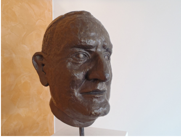
Abb. 1: Johannes XXIII / Centro Papa Giovanni Emmenbrücke Luzern

sind?“ 2 Anders gefragt: Warum wurde in jüngerer Zeit vermehrt dem Ersten unter den Gleichen, dem Primus inter Pares, eine höhere Heiligkeit zugeschrieben? Was bleibt sinnvoll an der allgemeinen Heiligenverehrung? Welche kreativen Zugänge zu Identifikationsfiguren für die Glaubenspraxis sind möglich, nachdem sich unzählige Menschen von der Jahrtausend-Institution abwenden, und ernüchtert über ein gehäuftes Selig- und Heiligsprechen den Kopf schütteln? Dagegen müsste die Heiligkeit als „Zuordnung der Menschen zu Gott“ als „Leitidee der Jüdischen Bibel“ zentral bleiben, wie Walter Kirchschläger festhielt und betonte, dass „diese Heiligsprechungsflut [...] keine rühmliche Entwicklung“ ist. Auch sei ökumenisch betrachtet