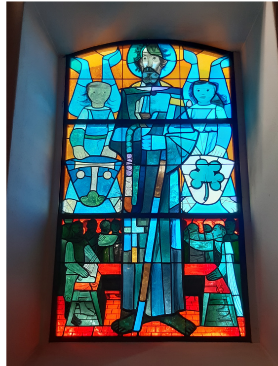
Abb. 4: Bruder-Klaus-Fenster / Felsenkapelle Rigi

weist in diese realitätsnahe Richtung. Die Erfahrung Gottes konfrontiert mit der menschlichen Ambivalenz, dem Wissen um das Gute und das Böse, weshalb Luther betonte, dass Gott Heil und Unheil hervorbringt und Gott selbst (Deus ipse) „gar nicht wahrnehmbar, sondern nur individuell aus seinen uns rätselhaften Werken erschliessbar“ 11 ist. Im Blick auf die Seelsorge kann darum Dietrich Stollberg hervorheben: „Wer sich um den verborgenen Ratschluss Gottes kümmert, der sündigt wie Adam, will wissen, was nur Gott weiss, und ihm gleich sein. Statt dessen soll er sich dem, was er weiss und wahrnimmt, zuwenden, vor allem seinen Mitmenschen und denen die die Vergebung zum einen verkündigen und zum anderen brauchen. ‘Nicht Phantasie, sondern Realität’, so könnten wir sagen, ist Luthers seelsorglicher Ratschlag.“ So gesehen werden Menschen, die sich vor Gottes Angesicht stellen, zu „radikal geistlicher Armut“ geführt. Diese kann „in einem tieferen Sinn als ‘Glauben’“ bezeichnet werden. Sie geht einher mit der Zerbrechlichkeit und Vergänglichkeit menschlichen Lebens. Hat geistliche Armut den Abschied aus selbstischer Haltung zur Folge, gewinnt die Haltung geistlicher Einfachheit Raum im Hier und Jetzt, der Wirklichkeit in „ihrer heiligen Unabhängigkeit“. 12 Damit ist ein Kernkriterium für die Lebensgeschichten von