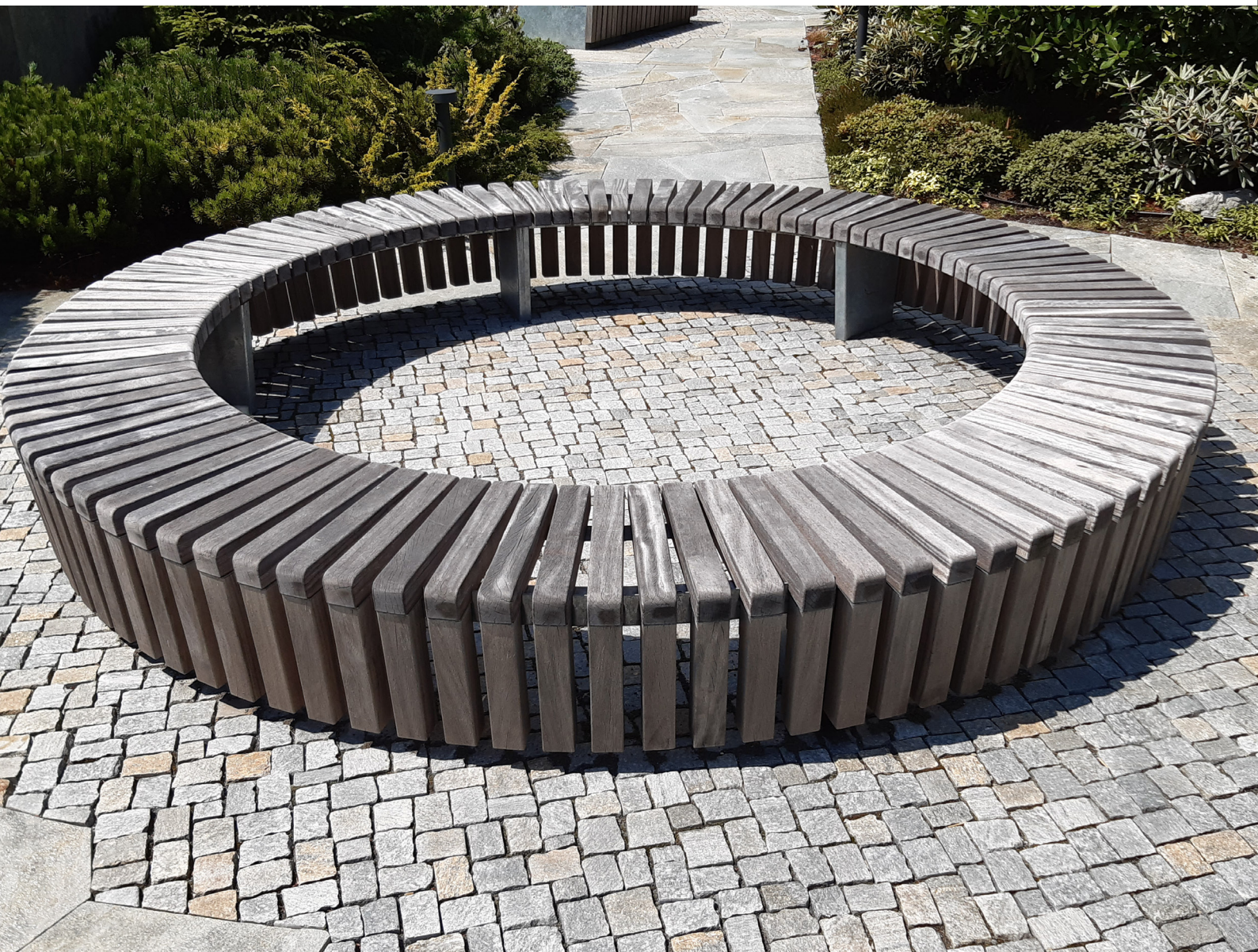
Abb. 8: Sitzkreis Bürgenstock Hotels/Nidwalden

Im Katholizismus hat die Verehrung der Heiligen ihre spezifischen Chancen und Grenzen, wie 2018 Franziskus in „Gaudete et Exsultate“ festhielt. 28 Gegen den Strom der Gewohnheit führte er aus: „Die Worte Jesu mögen uns poetisch erscheinen, sie richten sich jedoch deutlich gegen den Strom der Gewohnheit,