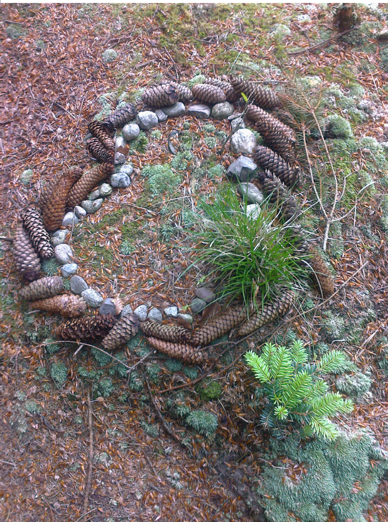
Abb. 2: Ein heiliger Kreis/Bireggwald Luzern

eigenen Verantwortung verpflichtet vollständig dem Diesseits ergibt, nachdem sie dem Jenseits wenig mehr abgewinnen kann. So findet Julia Blanc zwei Antwortgruppen auf die Frage, wie dem Heiligen in der Natur begegnet wird. 5 Es werden Kraftorte ausserhalb von sich selbst genannt, „die sich meist durch Unberührtheit auszeichnen“ oder das Meer, welches „bei der Transzendierung der Umgebung und dem Erkennen einer übermenschlichen Präsenz“ seit der Kindheit der Befragten Bedeutung erhielt. Die zweite Gruppe erfährt Heiliges „im eigenen Sein oder Tun“, vor allem im Geschehen von „Geburt und Entstehung des Lebens“.