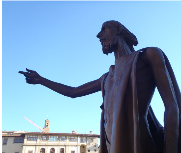
Abb. 5: Giuliano Vangi (1996): San Giovanni Battista / Firenze | © St. Schmid-Keiser

einer Form von unseligem Machtverhalten bis in die jüngste Zeit terroristischer Gewalt, von Kriegen unter Völkern, verfeindeter Religionsgemeinschaften oder herrschaftlicher Ansprüche im Rahmen eines politischen Messianismus. Und sie befeuert das Entstehen von Verschwörungstheorien ebenso wie missbräuchliches Agieren in seelsorgerlichen Beziehungen.