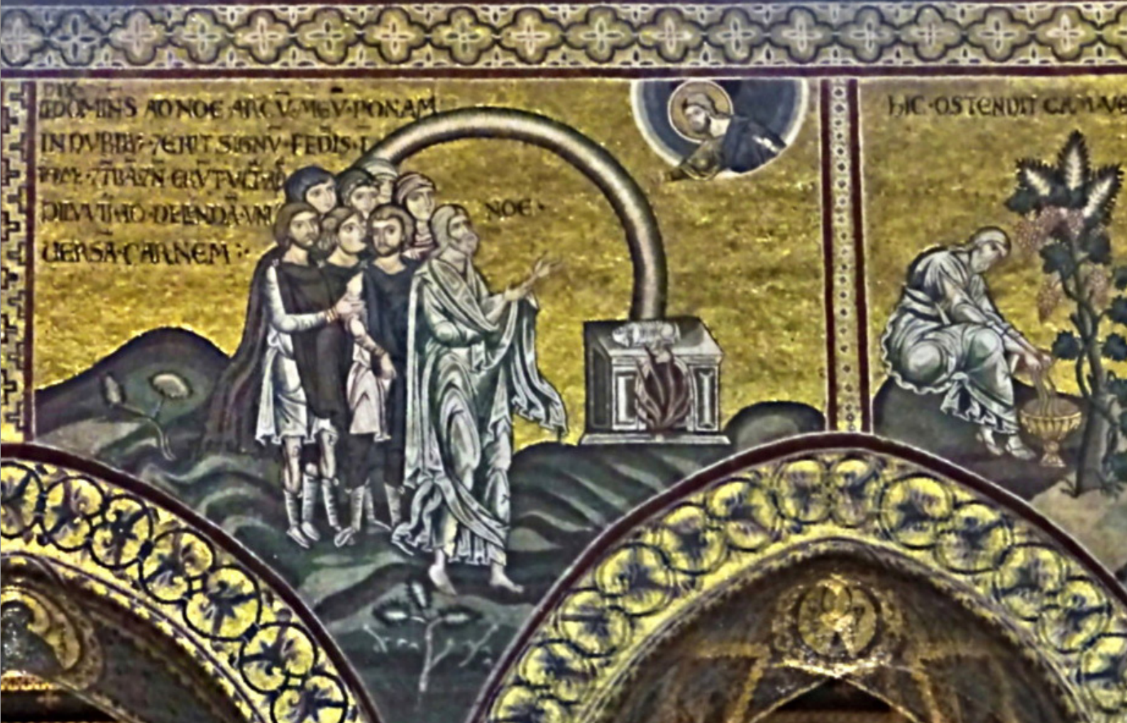
Abb. 3: Mosaik in der Kathedrale Santa Maria Nuova in Monreale

stehen gefordert. Dies betrifft vor allem die Dimensionen des Raumes, der Zeit und religiöse Riten.