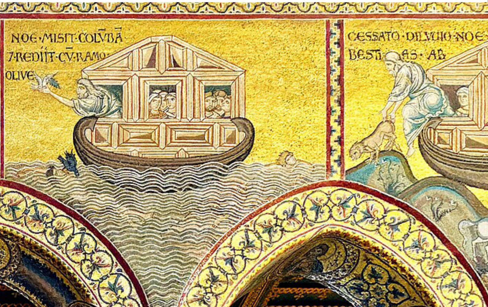
Abb. 2: Mosaik in der Kathedrale Santa Maria Nuova in Monreale