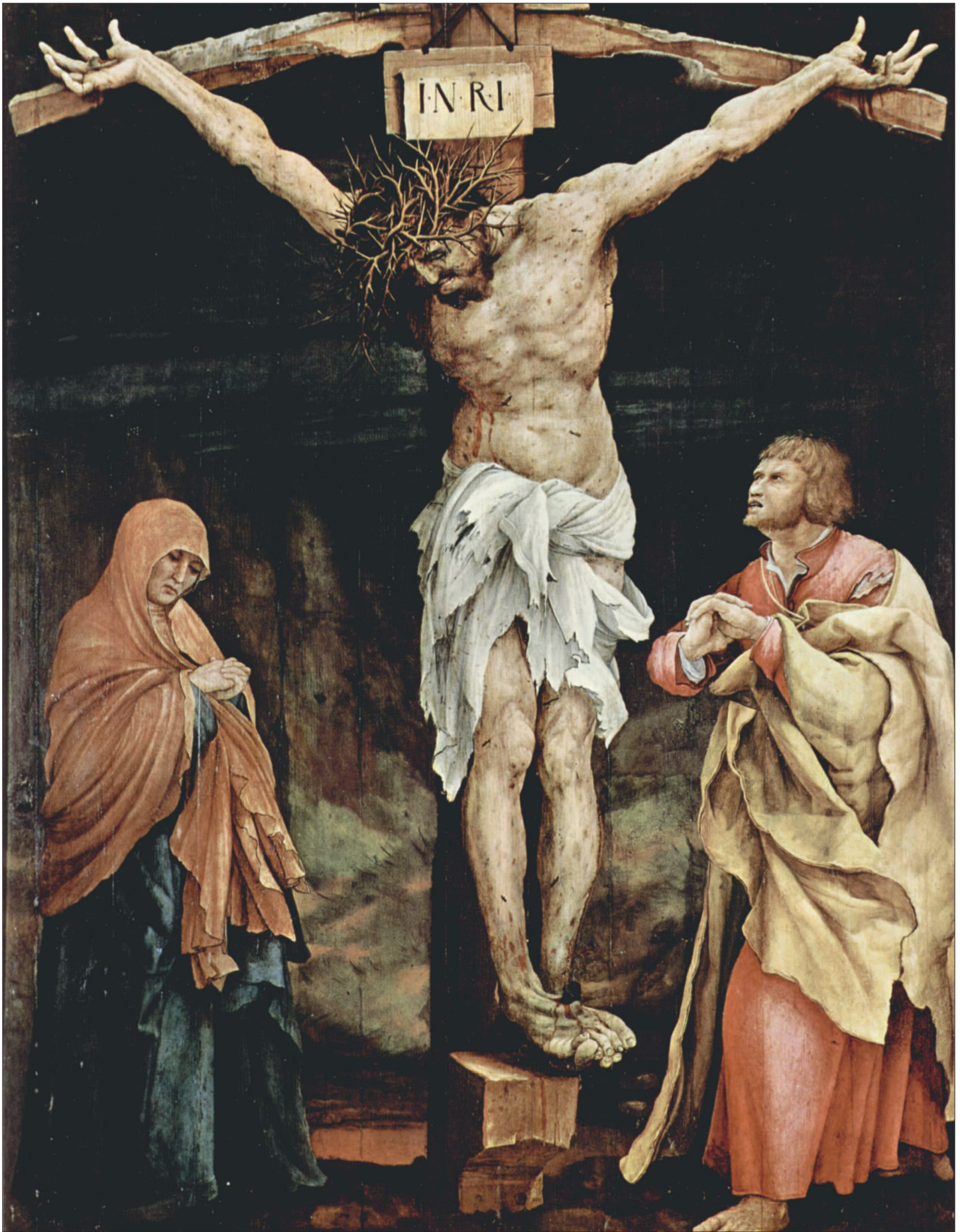
Matthias Grünewald (1470 – 1528): Die Kreuzigung Christi Tauberbischofsheimer Altar, 1521/22