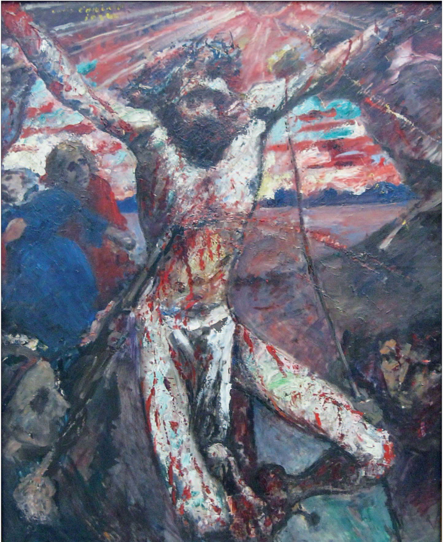
Lovis Corinth (1858–1925): Der rote Christus, 1922